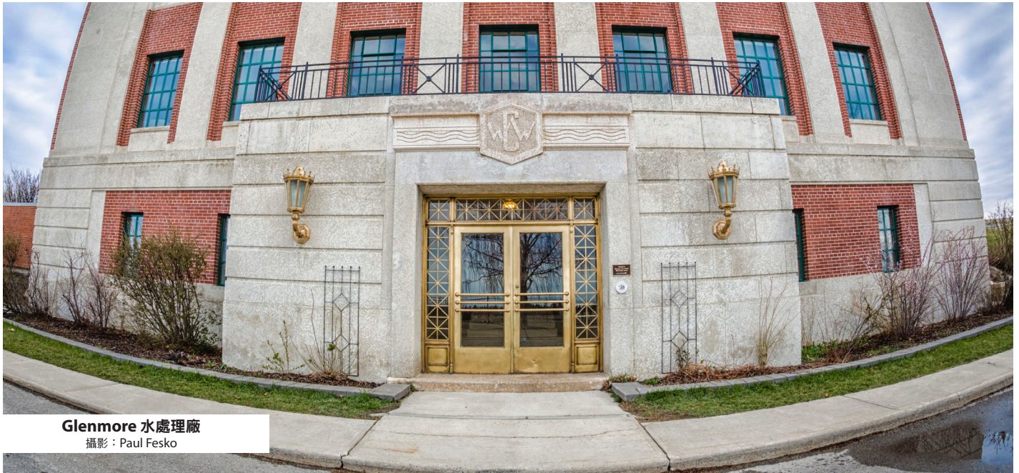
Glenmore 水處理廠