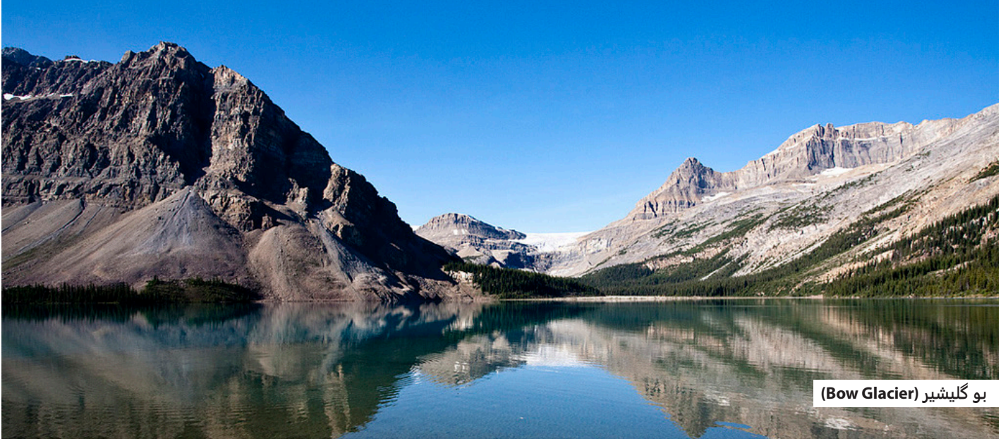
بو گلیشیر (Bow Glacier)

دریائے بو (Bow River) کا ماخذ فاصل آب (واٹرشیڈ) 7,770 \text{ km}^2 کے رقبے پر محیط ہے۔ یہ دریا جھیل لوئس (Lake Louise) کے شمال میں بو گلیشیر سے نکلتا ہے اور دریائے اولڈ مین (Oldman River) اور دریائے ریڈ ڈیئر (Red Deer River) کے ساتھ دریائے جنوبی ساسکیچوان (Saskatchewan) کے تین اہم معاونی دریاؤں میں سے ایک ہے۔ دریائے بو (Bow River) کا ماخذ فاصل آب (واٹرشیڈ) وسیع تر دریائے بو بیسن (Bow River Basin) واٹرشیڈ کا ایک حصہ ہے جو جنوبی البرٹا میں 26,000 \text{ km}^2 پر محیط ہے۔