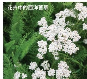
花卉中的西洋薔草

這種多年生植物有蕨類植物般的葉子，在茂密的墊子上形成蓮座叢，花朵在夏中至夏末盛開。它在貧瘠的土壤中生長良好，能吸引傳粉者及益蟲。某些品種原產於亞伯達省，通常不需要土壤改良劑即可成功生長。